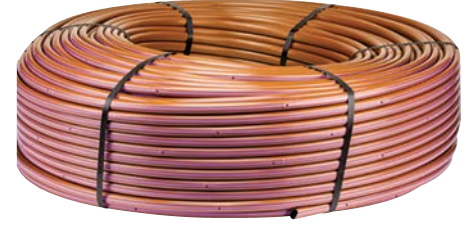
HDL-R (Arıtılmış su)

Arıtılmış su kaynakları için isteğe bağlı renk opsiyonu (yalnızca 17 mm'lik için mevcuttur).