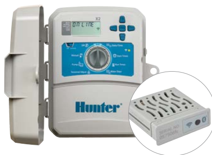
Programmatore X2 con modulo WAND 4, 6, 8 e 14 stazioni