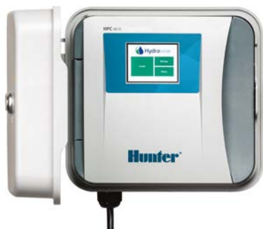
Programmatore HPC Da 4 a 32 stazioni, opzione EZDS a mon cavo