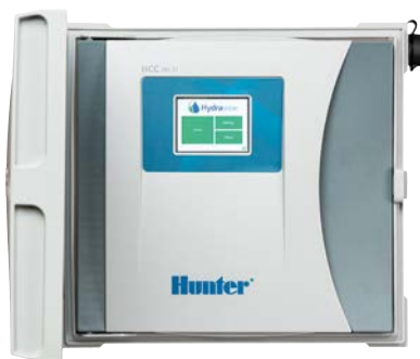
Programmatore HCC da 8 a 54 stazioni, opzione EZDS a mon cavo