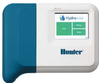
Programmatore HC 6 e 12 stazioni

Riconosciuto come apparecchiatura utile per il risparmio d'acqua