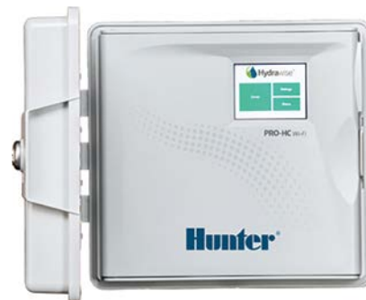
Programmatore Pro-HC 6, 12 e 24 stazioni