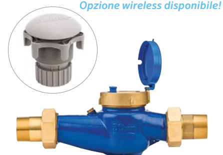
Misuratore di portata HC Aggiungete un misuratore di portata opzionale per ricevere avvisi sulla portata e monitorare il consumo idrico