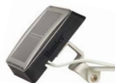
SPXCH Kit de painel solar (opcional) Altura: 8 cm Comprimento: 25 cm Largura: 8 cm