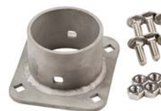
XCHSPB Somente suporte e material de montagem (opcional)