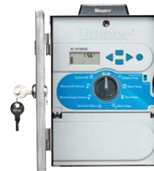
Solar de aço inoxidável Altura: 27 cm Largura: 19 cm Profundidade: 11 cm