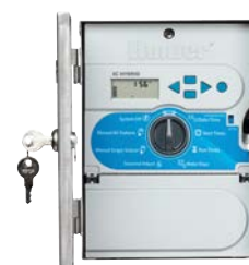
Aço inoxidável Altura: 25 cm Largura: 19 cm Profundidade: 11 cm