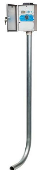
XCHSPOLE Kit de montagem em poste (opcional) Altura: 1,2 m