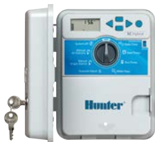
Plástico Altura: 22 cm Largura: 18 cm Profundidade: 10 cm