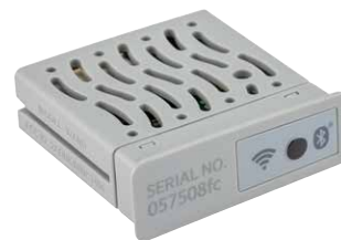
Moduł Wi-Fi WAND

Wysokość: 2 cm Szerokość: 5 cm Głębokość: 5 cm