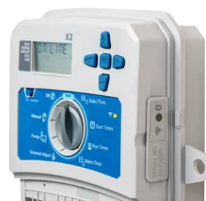
Moduł WAND zainstalowany w sterowniku X2

Wysokość: 2 cm Szerokość: 5 cm Głębokość: 5 cm