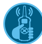
Pilot ROAM Pilot ROAM XL